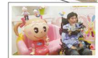
ヤマサ蒲鉾 さっちゃんの家